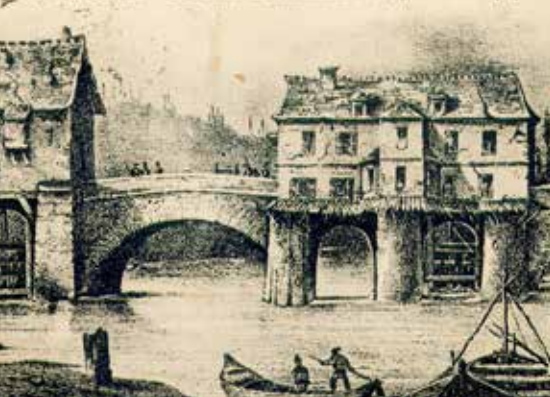
7. - PONTOISE. — Le Pont et les Moulins en 1833, gravure de l'Époque.